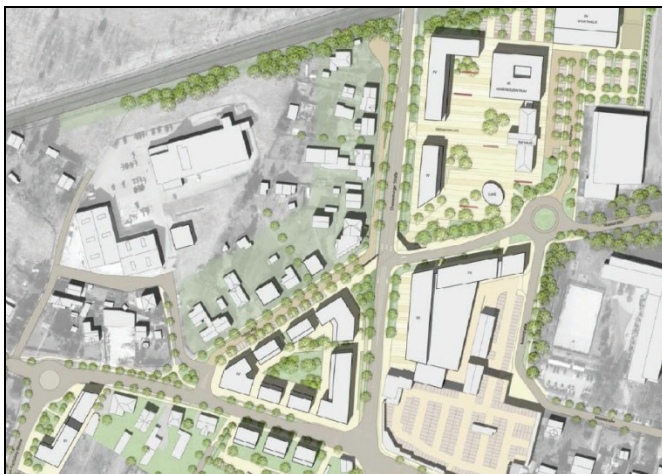
Neues Stadtzentrum Hohen Neuendorf: Städtebauliches Gesamtkonzept

Die Stadt Hohen Neuendorf möchte ihre Verwaltungsstandorte zukünftig im Umfeld des vorhandenen Rathauses konzentrieren. Darüber hinaus soll am Wildbergplatz ein attraktiver Wohnkomplex entstehen. Beide Standorte sind derzeit unzureichend in den Stadtraum integriert und weitgehend von Verkehrsanlagen und ungestalteten Freiflächen geprägt.